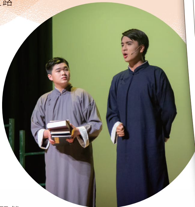
(圖二:2021年，參演《何者魯迅》)

不久，這份衝動又將我的戲劇之路推上一個新的高度，我得到一個機會去參演校外的大型舞台劇，而這個經歷，是畢生難忘，縱使要經常由大西北往返九龍，每晚排戲到深夜，但當中新結識的朋友、新吸收的經驗、新感受的快樂，它留下的回憶只有忘我般的享受，也為我人生定下一個基調——縱使不視戲劇為終身事業，終身也離不開戲劇。