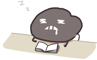
塵躺在班桌上呼呼大睡……