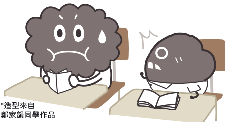
塵慌張地四周觀望， 突然一個熟悉的身影 出現在他面前……