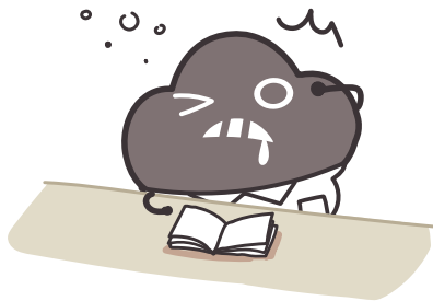
突然感到心緒不寧而驚醒了！