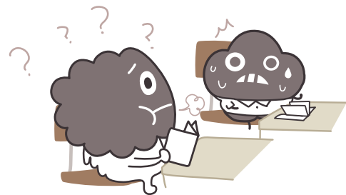
塵內心有很多想向他說的話， 大多是「歉意」。