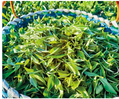
■白露時初摘的茶葉

如今新曆九月，是農曆八月，時值秋天，「白露」與「秋分」之間。《月令七十二候集解》有云：「白露，八月節……陰