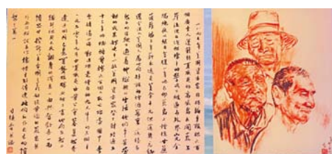
司徒喬：《三個老華工》

行商代徵關稅、管理外商，珠江畔商館林立，成為全球貿易樞紐。茶葉、絲綢、瓷器經此輸往歐美，換回白銀與西洋奇器。行商創「廣東英語」溝通，促成中西文化交融，外銷畫、廣彩瓷風靡歐洲。鴉片戰爭後，《南京條約》五口通商，廢除壟斷，1856年大火焚毀商館區，終結其170年輝煌。十三行見證清朝盛衰，既是閉關政策的產物，亦為近代中國打開全球化初窗。