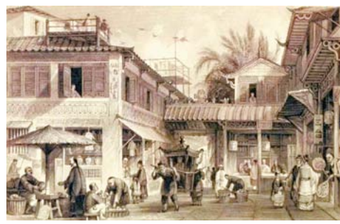
西方版畫廣州十三行的繁華景象

顯赫，美國《華爾街時報》曾稱他是「世界上最大的商業資產，天下第一富翁」。要知十三行是唯一官方授權的對外貿易機構，有了朝廷撐腰，造就其成績斐然，更有一個「天子南庫」的霸稱。同時，十三行也是農耕文明和海洋文明碰撞的觀實驗室，對中國的經濟、政治和文化歷史產生深遠的影響。