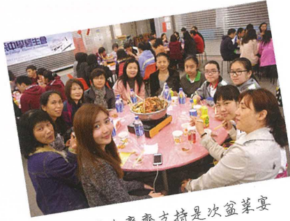
家長學生齊齊支持是次盆菜宴