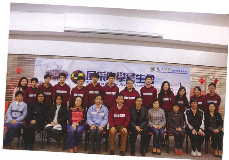
2015年度風采中學舊生會春茗盆菜宴完滿結束，多謝大家支持!

有興趣為凝聚校友的舊生請把畢業年份，班別，姓名，個人聯絡電話電郵至舊生會電郵 ecaaecc@gmail.com