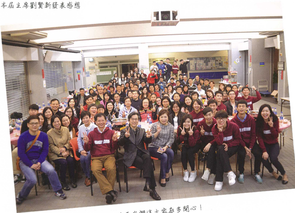
看看我們這大家庭多開心!